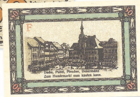
Notgeld der Stadt Apolda vom 1. August 1921 mit einem Hinweis auf den Apoldaer Hundemarkt

eine Zucht von bis zu 80 Tieren betrieb, vermarktete beides zusammen – und brachte den „Echten Dobermann's Bitter“ unter die Leute. Göller war auch Initiator des Vereins und blieb bis zu seinem Tode dessen Vorsitzender.