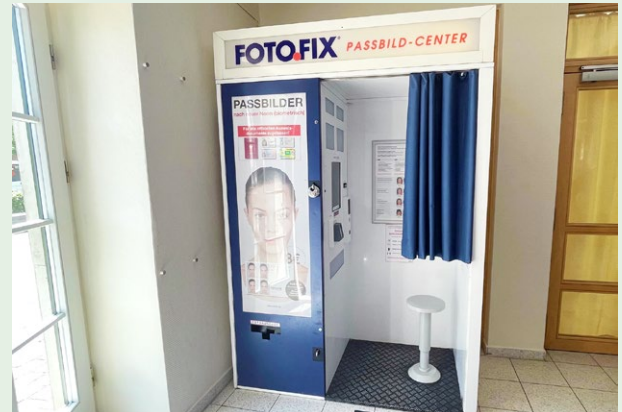
(barrierefreier Zugang über den Eingang der Vorderseite des Schlosses)

Eingang in der Torfahrt des Schlosses, Erdgeschoß