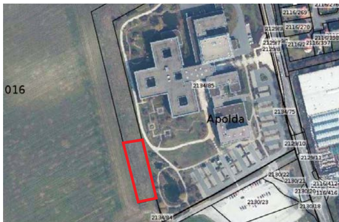
Lage der externen Kompensationsmaßnahme M1/M2 (skizzenhaft, ohne Maßstab).