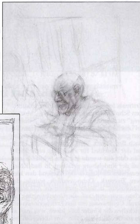
Foto oben: Henri Matisse, 1954 Bleistift, 48,5x32,5 cm Graphische Sammlung der Staatsgalerie Stuttgart