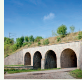
Flurstedt Eisenbahnviadukt Bettelstein a. Ortsrand