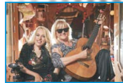
Blind & Lame