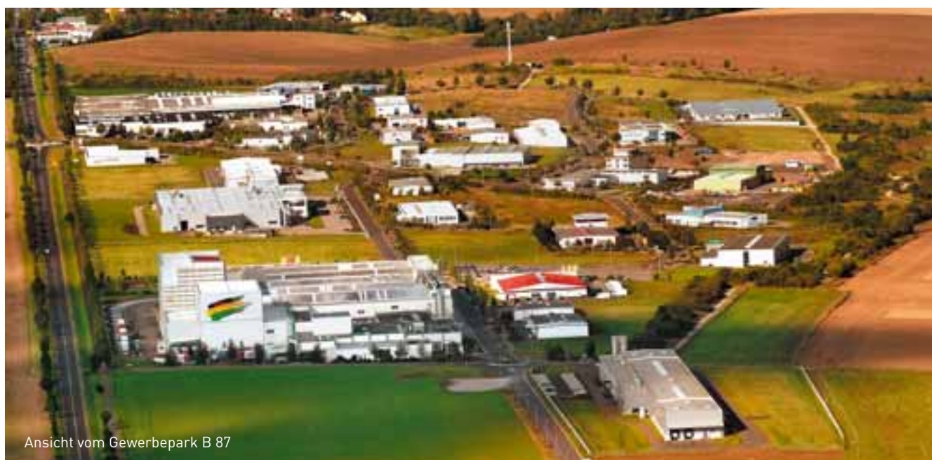
Ansicht vom Gewerbepark B 87