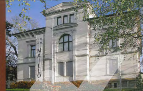
Kunsthaus Apolda Avantgarde