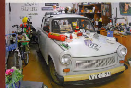
Museumsbaracke „Olle DDR“