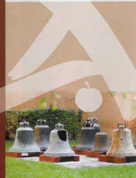
Glockenmuseum | Stadtmuseum