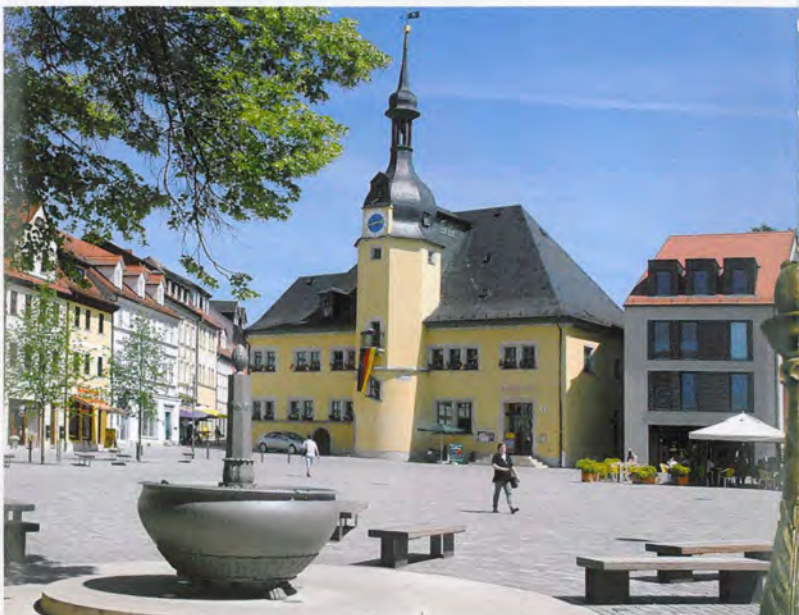
Marktplatz mit Rathaus

Weiter geht es dann in die Bahnhofstraße. Dort steht das ehemalige „Lager und Comptoirhaus“ der Firma Christian Zimmermann & Sohn – der „Zimmermannbau“ – Sitz des Landratsamtes des Weimarer Landes. Ein besonderes Augenmerk verdient das am Gebäude befindliche Terracottafries, welches den „Weg der Wolle“, die Herstellung von Strick- und Wirkwaren, anschaulich verdeutlicht.