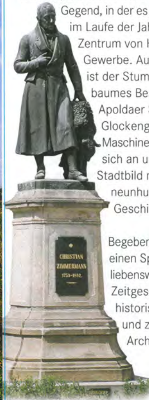
Zimmermann-Denkmal Glockenmuseum und Stadtmuseum

„Apolde“, erstmals 1119 urkundlich erwähnt, entwickelte sich in „einer Gegend, in der es viele Äpfel gibt“, im Laufe der Jahrhunderte zum Zentrum von Handwerk und Gewerbe. Auch heute noch ist der Stumpf eines Apfelbaumes Bestandteil des Apoldaer Stadtwappens. Glockengießer, Stricker, Maschinenbauer siedelten sich an und prägten das Stadtbild mit seiner fast neunhundertjährigen Geschichte. Begeben wir uns also auf einen Spaziergang voller liebenswerter Details der Zeitgeschichte, kulturhistorischer Gebäude und zeitgenössischer Architektur.