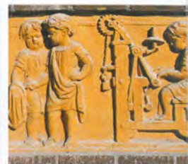
Weg der Wolle, Relief am Zimmermannbau