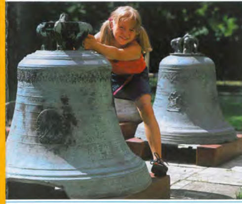
Blick auf Apolda Glocken im Garten des Glockenmuseums