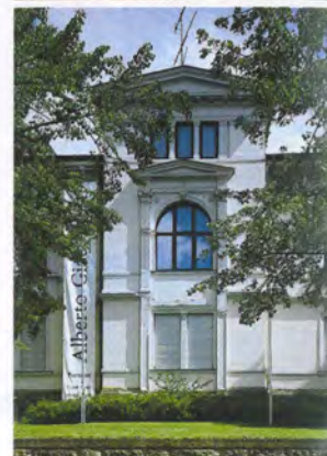
Kunsthaus Apolda Avantgarde